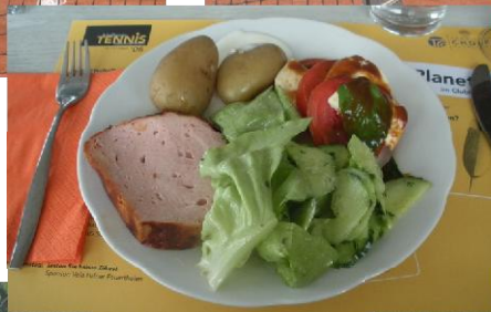
Das Essen ist immer fein...